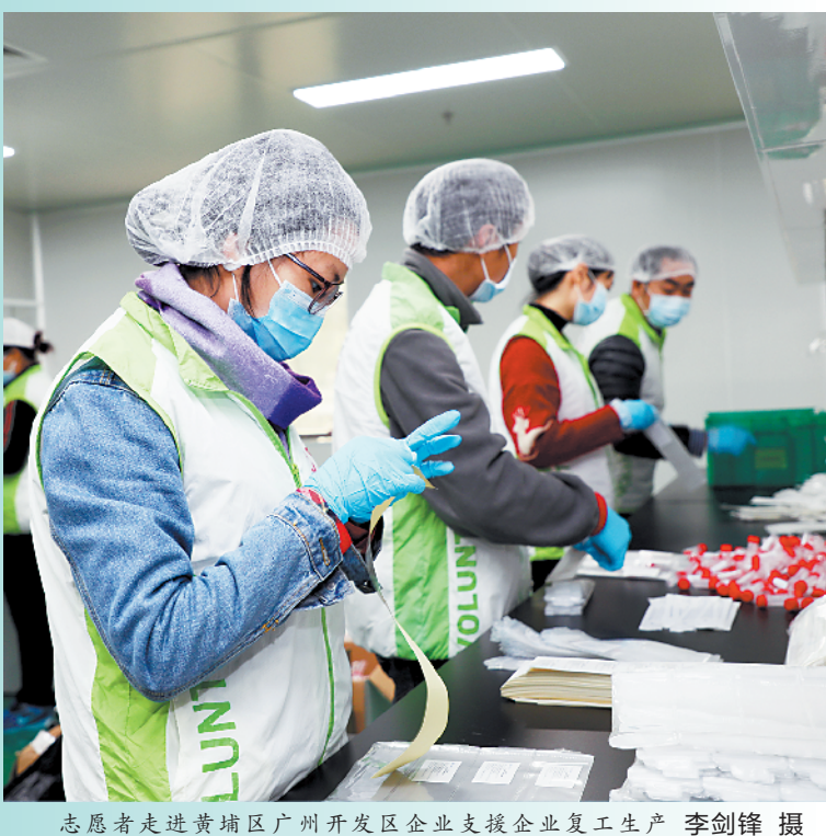
志愿者走进黄埔区广州开发区企业支援企业复工复产

作为《广东省人民政府关于企业复工和学校开学时间的通知》中提到的五类特殊行业之一，永益医疗从年初三（1月27日）开始复工复产，而更多广东企业将在元宵节后进入复工复产高峰期。连日来，为帮助企业安全有序复工复产，政府出台的护航政策“陆续有来”。广东已经吹响“抗疫”形势下复工复产的集结号，在疫情防控、物资保障、生产调度、人员管理等各方面精准施策，下足“绣花功夫”。