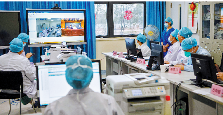
广东医疗队武汉前方ICU团队昨日与广州医科大学附属第一医院举行远程视频会议

11日下午，钟南山院士带领团队在广州医科大学附属第一医院与武汉协和医院西院连线，开展了一次远程会诊。钟南山院士、广州医科大学附属第一医院党委书记黎毅敏等专家与在武汉前线的广东医疗队张拥富、徐远达等医生对2例危重症病人情况进行讨论，制定治疗方案。这也是广东与武汉救治前线第一次跨省远程会诊。接下来，两地远程会诊将逐渐常态化。