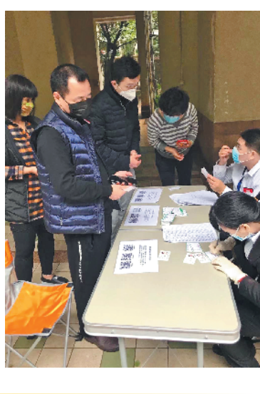
核査约600名湖北来穗人员

如今,各个小区物管成为疫情联防联控的第一线,也是外防输入、内防扩散最有效的防线。根据广州市防控新冠肺炎疫情工作指挥部办公室发布的通知,除整户抵穗或具备单独居住条件的人员允许居家隔离健康观察外,对所有湖北新抵穗人员,一律实施集中隔离健康观察,14天后无症状方可解除观察。