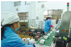
广药集团花城药业马不停蹄生产抗病毒口服液等产品

2月17日，在广州医药有限公司，在公证处的全程见证下，“穗康”启动了首次口罩预约摇号，7万名市民幸运选中；更早之前的春节假期，万家团圆时，广药集团白云山和黄中药、陈李济药厂、明兴药业等企业的生产车间却是灯火通明：板蓝根、喉疾灵胶囊、清开灵……一批批防疫应急储备药物从这里加班加点产出，又被紧急送往医院药店，支援临床医疗一线，保障市民家庭用药。