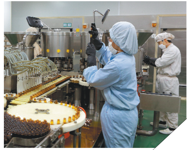
王老吉药业加紧生产应急药物