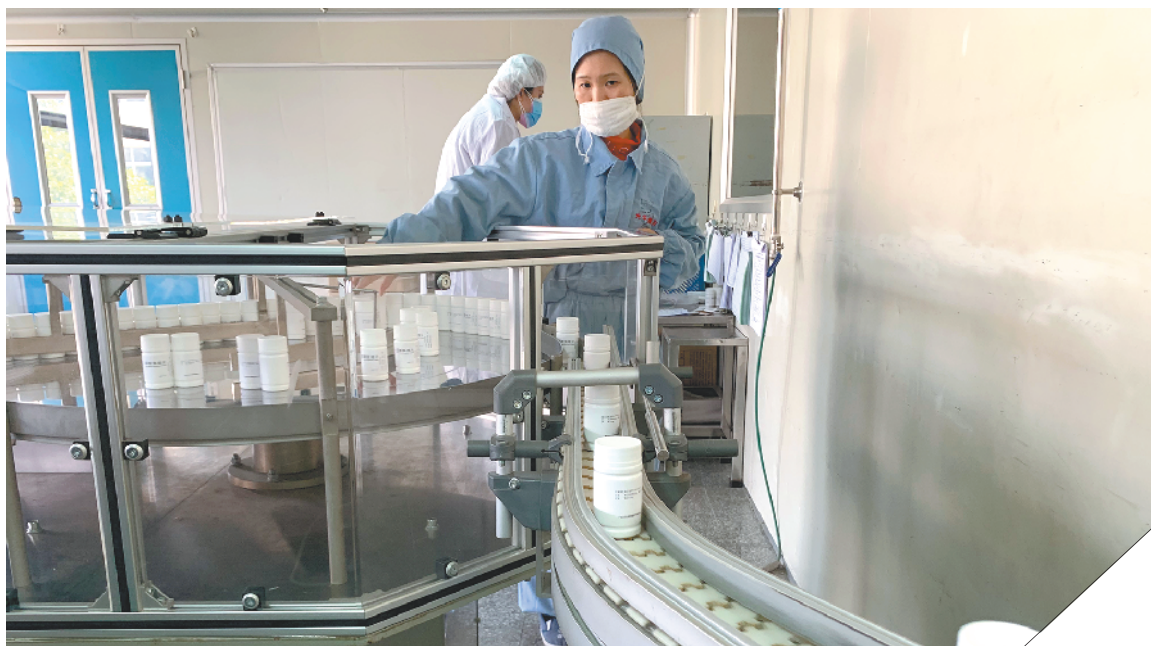
白云山光华制药磷酸氯喹的生产线正开足马力生产

目前，广药集团旗下白云山和黄中药、花城药业、光华药业、王老吉药业、中一药业、明兴制药、汉方药业、陈李济、敬修堂、星群药业、广州医药公司、采芝林等公司均已集结到位，加班加点投入到了抗疫药品物资的生产、储备和供应中，包括白云山板蓝根、花城药厂抗病毒口服液、王老吉药业克感利咽口服液、光华小柴胡颗粒、明兴清开灵、陈李济喉疾灵胶囊等需求量较大的产品都在协调生产，确保应急药品供应。