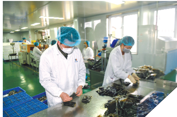
研发团队捕捉“先机”，病患用上了浓缩浸膏

企业从去年腊月廿七就开始生产邓老凉茶，每天提取三十多吨药材原材料，主要产品是邓老凉茶和中药浓缩浸膏。根据一线疫情需要调整产品生产。