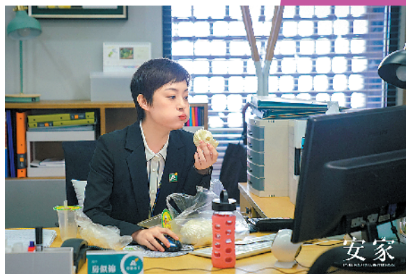
为呈现房产中介的真实状态，孙俪下了不少工夫

值得一提的是，每个单元都有大牌明星客串出演，化身买房子的客户：海清饰演面临换房困扰的医生宫蓓蓓，奚美娟饰演面对生活坦然淡定的江奶奶，韩童生饰演为子女倾尽毕生心血的平凡父亲，梁超饰演迷信命理的成功商人黄老板，郭涛、胡可出演财力雄厚的大客户阚氏夫妇……六六在接受采访时说：“电视剧里出现的每一个买房故事，都是创作团队在采访中真实经历的，有的啼笑皆非，有的感人肺腑。”