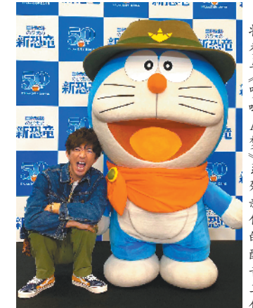
将参与《哆啦A梦》系列新作的配音工作

从70后到90后，谁会不知道木村拓哉？木村拓哉从上世纪90年代开始风靡东亚，《悠长假期》《冰上恋人》《HERO》等一系列高收视日剧奠定了他“日剧天王”的地位；他的长头发、格子衫、匡威帆布鞋、金属羽毛挂饰等装扮被众人模仿。不过，如今这群4至19岁的年轻观众从未目睹过木村拓哉的辉煌时代，他们又是因为什么而被圈粉？