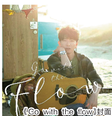
《Go with the flow》封面

自从2016年所在组合SMAP解散之后，木村拓哉的音乐活动就按下了暂停键。从今年开始，他以solo歌手的身份独闯乐坛：他在1月8日发行首张个人专辑《Go with the flow》；2月则在东京和大阪举行共5场演唱会，共计动员近7万观众参与。