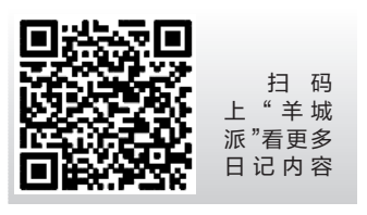
扫码上“羊城派”看更多日记内容

同时，为了减轻疫情给商家经营造成的压力，龙光商业宣布旗下在营商业于1月25日至2月24日期间，对各品牌商户实行租金五折优惠，以实际行动防控，也为城市传递真情。 爱在家园，这个特殊时期，佛山龙光在每一个龙光社区内安排