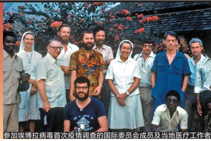
参加埃博拉病毒首次疫情调查的国际委员会成员及当地医疗工作者

战疫 刘小毅 正是迎春纳吉年， 江城黄鹤报凄然。 荆楚柴门宏毅勇， 八面援驰力克时艰。 一声集力克时艰， 医场奋作战场战。 济世擒魔颂大贤。