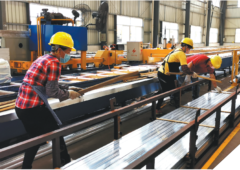
广东新合铝业新兴公司车间内，机器轰鸣运转

为了确保督导、宣传的全覆盖，当地梳理数据研判，多部门进行信息对碰，组织力量深入开展网格化摸查，督促企业落实主体责任通知到每位异地务工人员，建立重点疫区人员流动台账，劝告疫情重点地区务工人员延迟返岗。