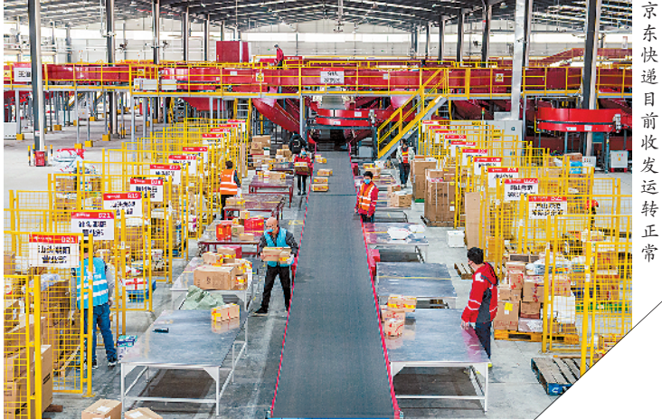
京东快递目前收发运转正常