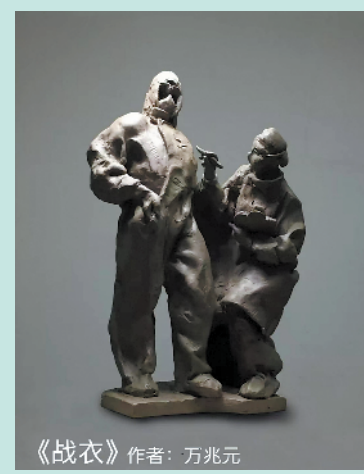
《战衣》作者:万兆元 ▲万兆元的泥塑作品《战衣》