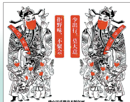
▲冯锦强的佛山木版年画《骑马将军》