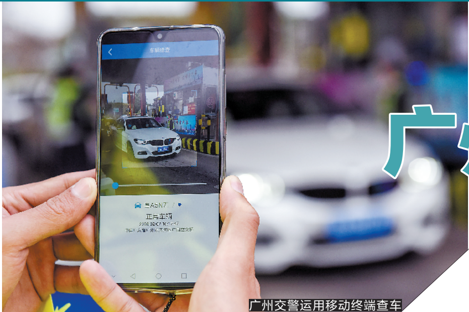
广州交警运用移动终端查车