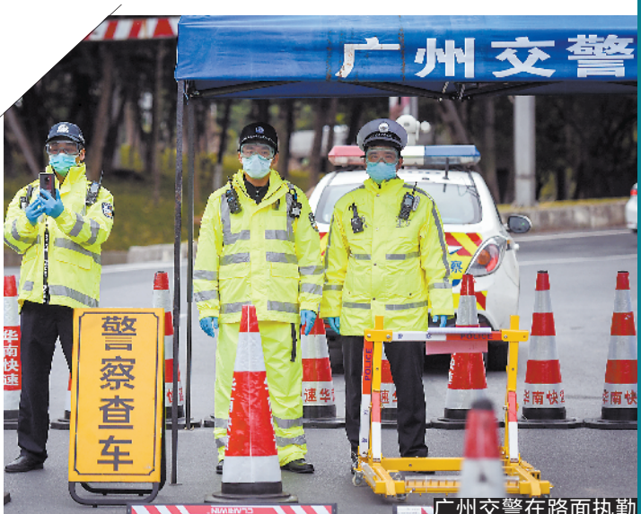
广州交警在路面执勤

加强宣传教育,切实引导市民科学出行。广州交警充分利用抖音、双微平台、户外电子显示屏等多种媒介,滚动发布出行相关出行和公安交管服务信息,引导市民网上办理公安交管业务,引导市民科学出行并提醒注意行车安全。