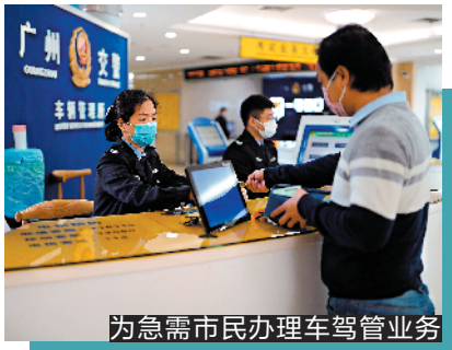
为急需市民办理车驾管业务

强化农村交通安全管理,切实消除交通安全隐患。充分发挥乡镇政府、农村派出所等基层组织的作用,组织“两站两员”,劝