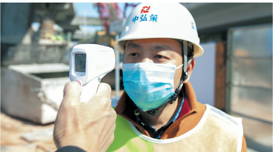
额温枪是复工复产重要防疫工具