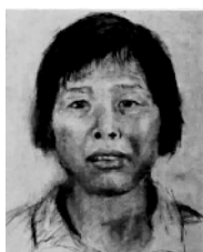
警方此前发布的“梅姨”画像