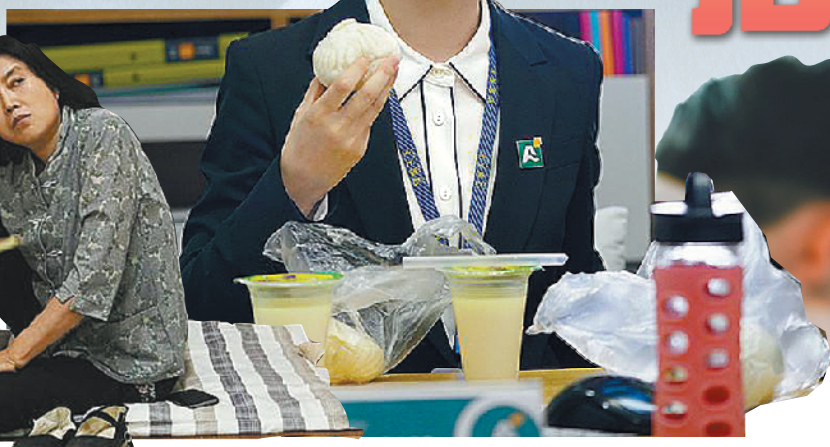
《安家》展现了形形色色的人生

但如果一部剧的人物、故事逻辑串联不畅，光宣泄焦虑情绪，却缺乏对生命底色的追寻，这类剧集的艺术价值一定不会高。如今剧集播出过半，你觉得《安家》是部好剧吗？