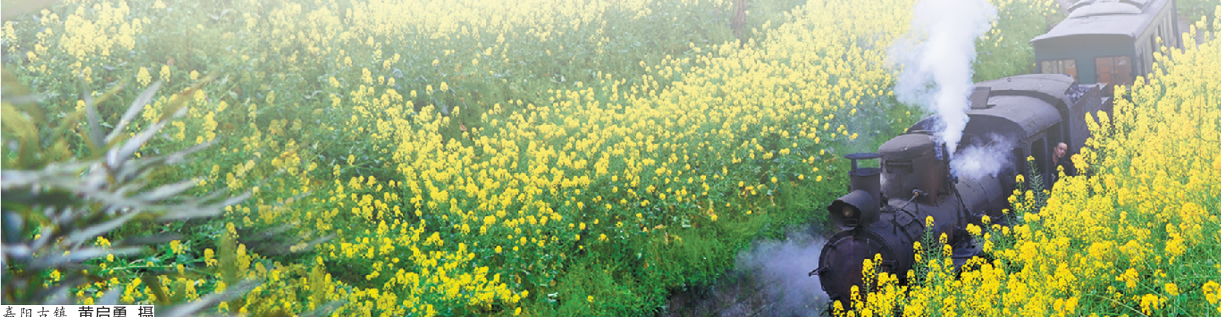
嘉阳古镇