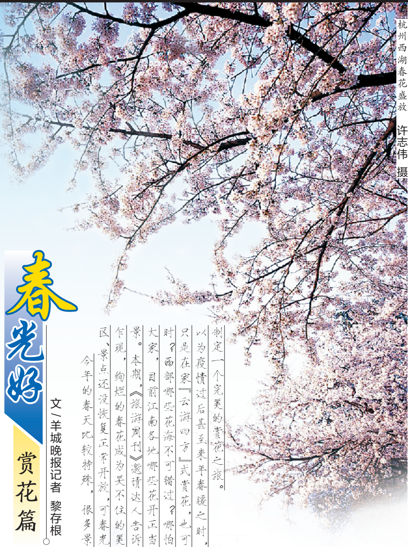
杭州西湖春花盛放

此外，还可借用城墙等细节。比如对准墙上的石缝儿或石缝儿间发芽的嫩草来拍，也能达到一新一旧的反差，营造更突出的视觉效果。