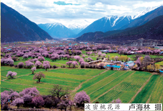
波密桃花源

贵州毕节：毕节的百里杜鹃景区有着“杜鹃王国”的美称，杜鹃丛林绵延百里，漫山遍野、品种繁多，低矮的灌木、高大的乔木应有尽有，每年杜鹃花期能从3月持续至5月。