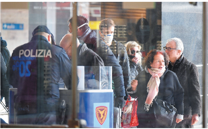
9日,在罗马泰尔米尼火车站,警察询问旅客出行信息 新华社发

据新华社电 意大利总理孔特9日晚发表电视讲话说,为避免新冠肺炎疫情进一步扩散,自10日起在全国范围内实施封城。除可证明的工作、健康和紧急需求三种特殊情况,全国范围内的民众不得擅自离开所在地。