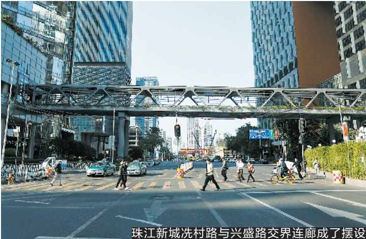
珠江新城洗村路与兴盛路交界连廊成了摆设