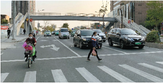
广州大道北同宝路口天桥因无电梯被街坊嫌弃