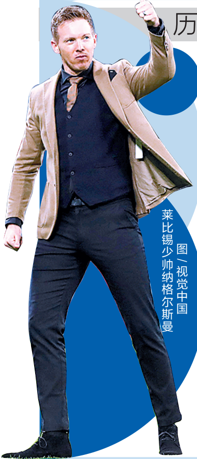
莱比锡主帅纳格尔斯曼

羊城晚报讯 记者郝浩宇报道：伤兵满营的英超劲旅热刺没能创造奇迹——在今天凌晨的欧冠1/8决赛次回合比赛中，客场被德甲莱比锡以3比0击败。莱比锡在比赛中全面占优，热刺几无还手之力，成立于2009年的莱比锡以两回合4比0的总比分历史上首次打进欧冠八强。