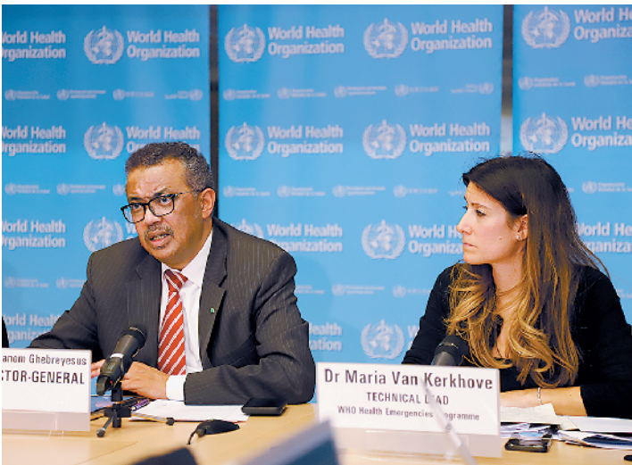
3月11日，谭德塞(左)在例行记者会上发言

他说，虽然大家都在关注“大流行”这个词，但“让我给你一些更重要、更可操作的词：预防、准备、公共卫生、政治领导，最重要的是——人。我们团结在一起，冷静地做正确的事情，保护全世界的公民，这是可行的。”