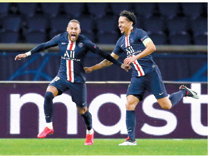
内马尔(左)庆祝进球

巴黎圣日耳曼连续4个赛季在欧冠1/8决赛遇上前欧冠冠军，前三次都被淘汰出局，今晨终于取得突破。大巴黎还取得另一个突破，首次在欧冠决赛首回合领先的情况下完成逆转。