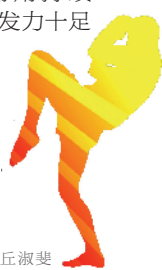
制图 / 丘淑婵

属于张伟丽的时代仍在继续, 未来期待她再次展现“中华女武神”的风采! 太棒了。恭喜你夺冠!” 对此张伟丽回应: “罗西给我做了榜样, 我也要努力成为别人的榜样。” 在隆达·罗西的时代, 女子格斗尽管引起关注, 但因为双方实力的不对等, 不断出现秒杀, 几乎成为个人表演赛。在 UFC170 比赛中, 她 TKO (技术上击败) 萨拉·麦克斯用了 1 分 06 秒, 在 UFC175 比赛里, 她 TKO 艾丽克斯斯仅用了 16 秒。所以, 在 UFC184 比赛之前, 白大拿宣称“如果罗西再次获胜, 那她接下来只有和男选手比赛了”, 结果比赛铃声响起 14 秒之后, 罗西以十字固终结了凯特·辛加诺, 把“男女对决”的难题丢给了白大拿。