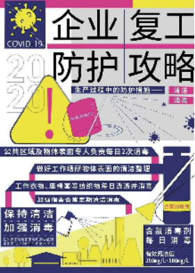
复工攻略(宣传海报) 王绍强、陈美欢领衔设计