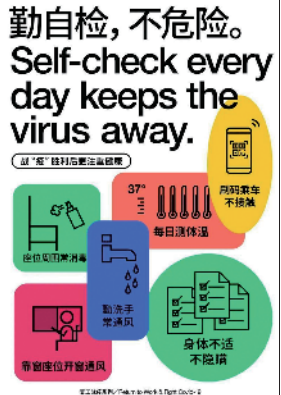
复工战疫(宣传海报) 王绍强、陈美欢领衔设计