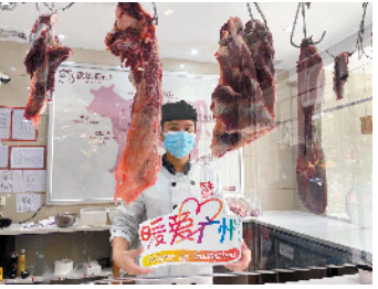
厨师亮出“暖爱广州”LOGO

除了线下实体店的“亮相”，“暖爱广州”的LOGO还在线上展示。截至3月15日17时，新浪微博“#暖爱广州#”话题接