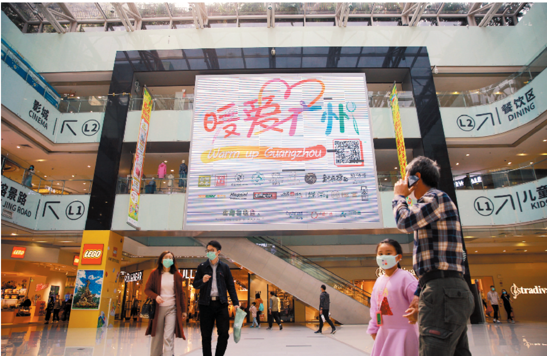
“暖爱广州”点亮乐峰广场大屏幕