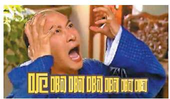
尔康的表情包走红网络