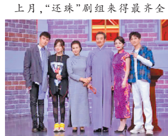
上月，“还珠”剧组亮相最齐全