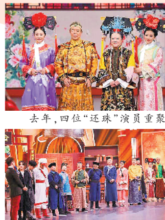
去年，四位“还珠”演员重聚

据悉，此次腾讯视频上线的琼瑶经典剧集中，既有《新月格格》《烟锁重楼》为代表的“两个永恒”系列，也有《梅花烙》《鬼丈夫》《水云间》组成的“梅花三弄”系列。而曾掀起全民追剧热潮，陪伴80后、90后群体成长的“暑期必看系列”《还珠格格》第一、二、三部和《情深深雨濛濛》等内地观众较熟悉的琼瑶剧，已进入该平台不同板块的电视剧热播榜，可见琼瑶剧依然保持高人气。