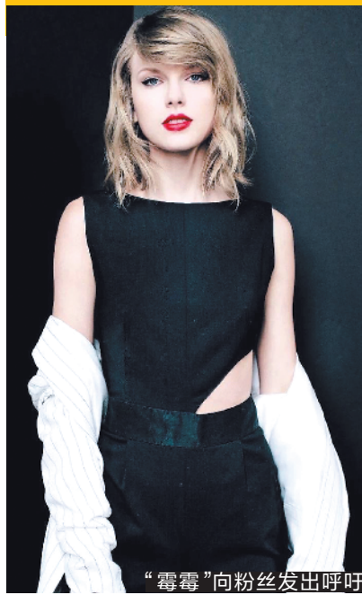
“霉霉”向粉丝发出呼吁