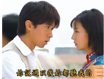
何书桓的台词“细思极恐”

而随着时代观念的变化，观众对琼瑶剧的剧情和角色也不断进行新的解读。湖南卫视每年暑期档都会播出《还珠格格》，观众在重看的时候评价也变了：当初单纯善良的令妃，如今被解读为“有心机”，皇后反而成了“傻白甜”……而去年最火的琼瑶剧角色新解，是《情深深雨濛濛》中的“何书桓”。有网友翻出何书桓的台词：“你说以后都听我的，但我又非常渴望你和我之间能够有共鸣。”“反正我会守护你，今生今世，你想逃离，再也不可能了！”并纷纷感慨，现在再看这些台词真是“细思极恐”，原来心目中的“深情男”是精神控制(PUA)的“鼻祖”。对此，古巨基最近在节目中也作出了回应，他替何书桓辩解道：“何书桓记忆力很强，像金鱼的记忆只有7秒，所以前言不搭后语。”