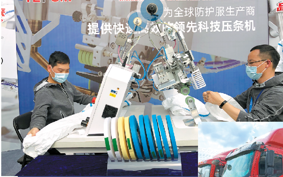
▲盈丰智能装备公司演示压条机生产防护服过程，疫情防控期间该公司将技术无偿提供给省属国企、央企 ▲盈丰智能装备公司将压条机设备装车运往防护服定点生产企业