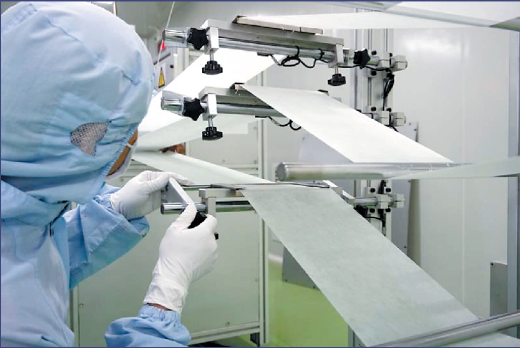
▲维达短时间内重启口罩生产计划，投入800万元增设车间设备