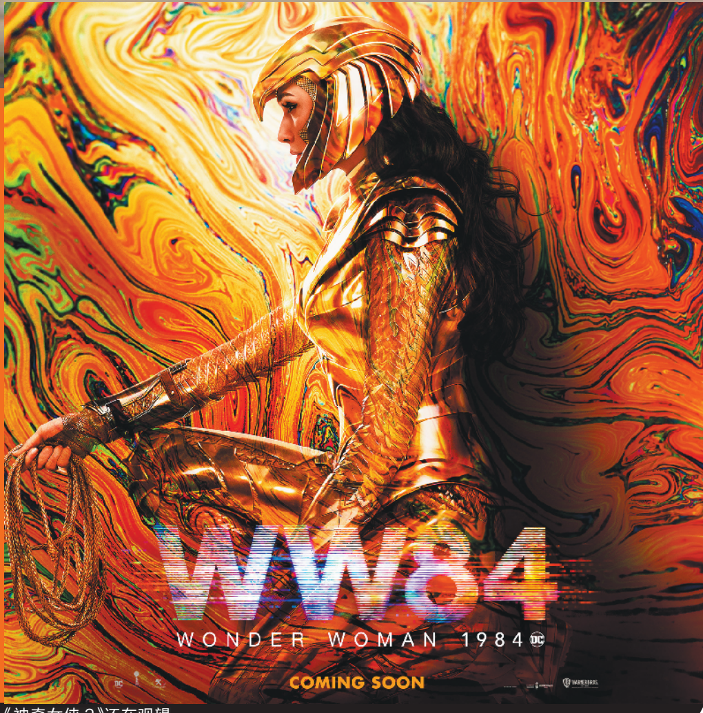
《神奇女侠2》还在观望