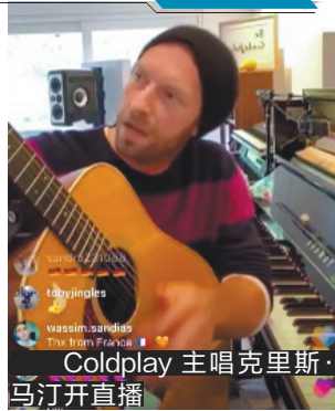
Coldplay 主唱克里斯·马汀开播

在居家隔离期间开“家里蹲个唱”的还有约翰·传奇,他的爱妻和孩子也同时出镜,当了一回伴唱和观众。One Republic乐队也开了线上居家演唱会,有时候弹错或唱岔了音就重来,自由自在。最有爱的是《邪恶力量》男主角詹森·阿克斯和他的女儿,两人居家时拍了一个夫妻俩一起翻唱《Crowded Table》的视频。