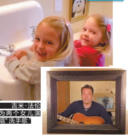
吉米·法伦为两个女儿演唱“洗手歌”