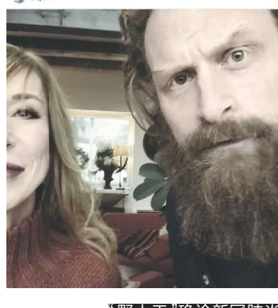
“野人王”确诊新冠肺炎

跟不少中国明星通过网络呼吁人们“勤洗手,少出门”一样,欧美明星也在网上用自己的影响力呼吁人们注意个人卫生,注重正确防疫。71岁的葛罗莉亚·盖罗将自己1978年的热门歌曲《I Will Survive》做成了一首同名“洗手歌”。视频里,她一边洗手,一边唱着歌,而视频的标题她最后定为:只需要20秒就能“活下来”!