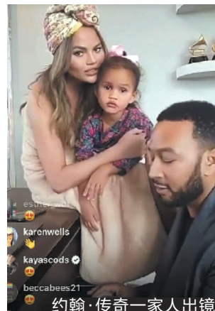
约翰·传奇一家人出镜