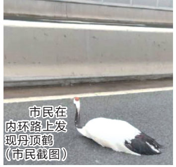
保护动物,体长一般 120~160 厘米,寿命长达五六十年。广州动物园相关负责人称,目前该园一共有 25 只丹顶鹤,均在园区湖里散养。这只“出逃看世界”的丹顶鹤还未成年,处于刚刚学飞阶段,但飞行能力已比较强,一跃跃过七八米高的围墙,便出现了“出逃”一幕。