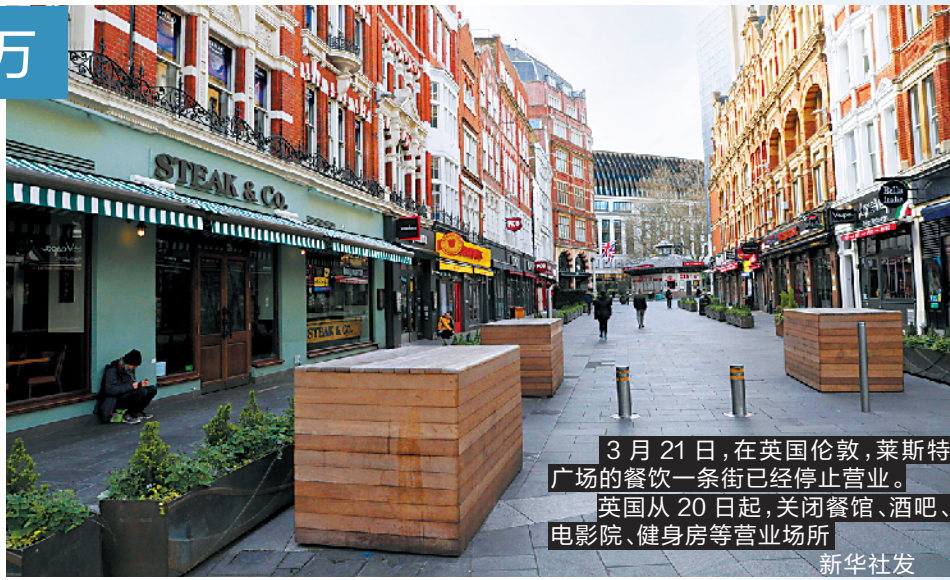
3月21日,在英国伦敦,莱斯特广场的餐饮一条街已经停止营业。英国从20日起,关闭餐馆、酒吧、电影院、健身房等营业场所

大利 10 日起进入全国“封城”状态,并从 12 日起关闭除食品店和药店以外的所有商铺,从 21 日起关闭所有公园和其他公共场所,但公共交通、物流、邮局、银行和食品生产行业维持正常营业和运转,以保证对公众的基本生活服务。