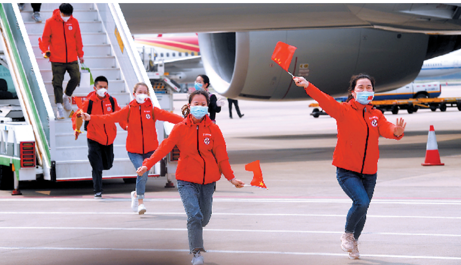
22日,广东省支援湖北武汉第一批、第二批、第十九批、第二十四批(心理团队)医疗队共313名队员返粤

此次返粤的医疗队队员共313名,分别来自广东省支援湖北武汉第一批医疗队、第二批医疗队、第十九批医疗队、第二十四批医疗队。队员们纷纷表示将继续践行医者初心,坚定前行,把战斗经历转化为工作动力,以更多的干事创业劲头,认真做好本职工作,为保护人民群众生命安全和身体健康作出更大贡献。