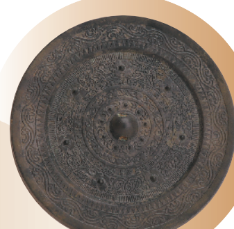
(汉代)“中国”铭七乳瑞兽纹镜