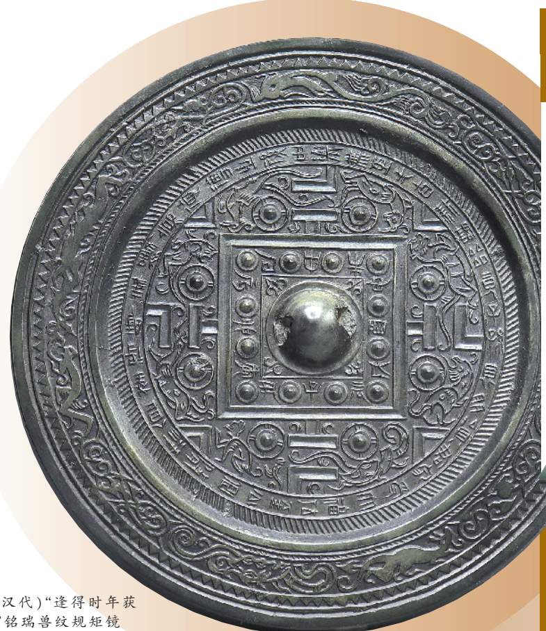
(汉代)“逢得时年获嘉德”铭瑞兽纹规矩镜

唐代铜镜的形制，在两汉魏晋南北朝的基础上进一步丰富，形状除圆形、方形外，出现了亚方形、菱形、葵花形、八角形等新颖的形状。镜钮也以生动、立