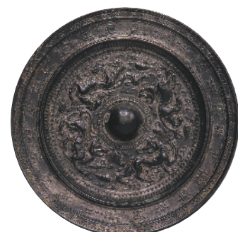
(唐代)“湛如止水”铭四瑞兽纹镜

在铜镜的保存上，建议对于铜镜避光防尘，保存温度在15℃—25℃，相对湿度45%—55%，40%以下更好，并定期检查。