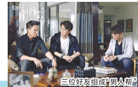
三位好友组成“男人帮”

李宗翰饰演的黄九恒是星级酒店的主厨,美食界大咖,也是一个老实温和的大叔。但他平静的生活被女儿的一次意外打破:女儿因运动过猛血管爆裂,医院需要家属输血,没想到,黄九恒通过对血型却发现,女