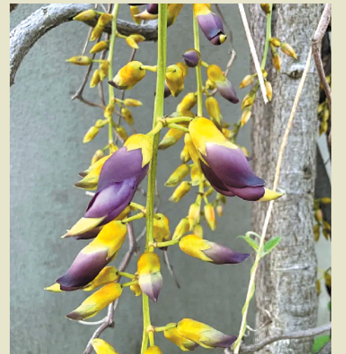
深紫色禾雀花是常春油麻藤的一种