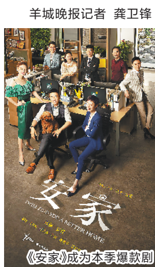
羊城晚报记者 龚卫锋

在新冠肺炎疫情下,不少人宅在家中,看电视成了主要的娱乐活动。近日,国家广播电视总局节目收视综合评价大数据系统(CVB)发布的2月份收视率统计结果显示,共有7部黄金时段电视剧、19档(61期)综艺节目、5部(54集)纪录片收视率超过1%。据统计,与春节期间(1月24日至2月9日)相比,2月10日至2月29日期间,全国有线电视和IPTV日均收看电视用户数持平,开机用户每日均收视时长为6.83小时,日均全国收视总时长小幅微降2.5%,但较春节前(1月1日至1月23日)仍保持了35.1%的涨幅。