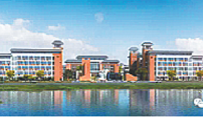
广州大学附属中学南沙实验学校效果图

计划数,则由南沙区教育局通过电脑派位方式确定录取名单。 2020年五校初中面向全区采用“指标到校+电脑派位”方式招生,按照1:3的比例确定电脑派位人数,上述学校全区电脑派位指标数按照各小学南沙区户籍毕业生人数占南沙区户籍毕业生总人数比例进行分配。符合条件的指标生通过电脑派位方式确定录取名单。五校划定范围招生录取完毕后,进行“指标到校+电脑派位”的录取工作。