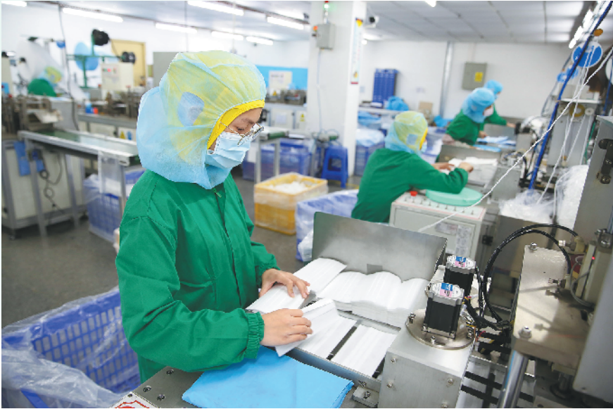
东莞产业供应链逐步复苏,为企业复工提供保障

东莞相关部门提供的数据也显示,广大制造企业的生产已逐渐恢复正常。根据东莞市人社部门的数据显示,截至3月20日,东莞全市复工企业21.45万家,在岗员工409.17万人,按照21.63万家企业为基数计算,复工率为99.17%,按照节前企业413.04万人计算,复岗率为99.06%。其中,规上工业企业复工10691家(全市共10657家),复工率为99.38%;在岗员工215.32万人(全市共209.69万人),复岗率102.69%。据介绍,东莞市的规上工业企业已复工企业数量和已复岗人员数量均排名全省第一。