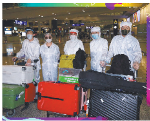
《女法医JD》主演回到香港