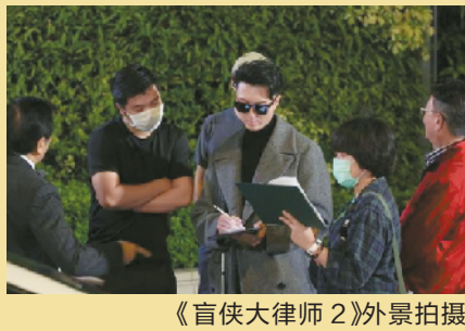
《盲侠大律师2》外景拍摄

新冠肺炎疫情之下,香港演艺圈的日子不太好过:剧组外景计划受阻、金像奖延期、演艺界工作机会减少、电影票房收入下滑……不过,向来“劳模”的TVB没有出现长时间停工的现象,各剧组根据疫情作出调整,拍摄工作仍在有条不紊的进行中。