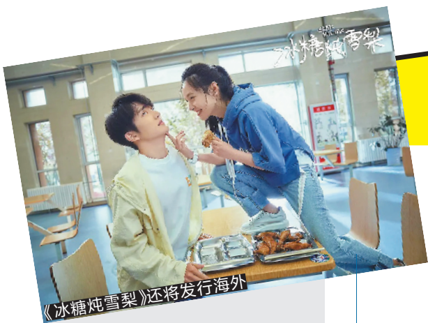
《冰糖炖雪梨》还将发行海外