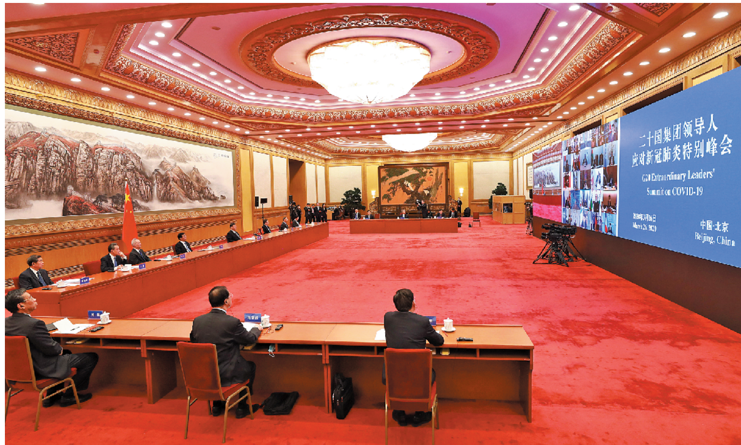
3月26日，国家主席习近平在北京出席二十国集团领导人应对新冠肺炎特别峰会并发表题为《携手抗疫 共克时艰》的重要讲话

据新华社电 国家主席习近平26日晚在北京出席二十国集团领导人应对新冠肺炎特别峰会并发表题为《携手抗疫 共克时艰》的重要讲话。习近平强调，当前，疫情正在全球蔓延，国际社会最需要的是坚定信心、齐心协力、团结应对，携手赢得这场人类同重大传染性疾病的斗争。中方秉持人类命运共同体理念，愿向其他国家提供力所能及的援助，为世界经济稳定作出贡献。