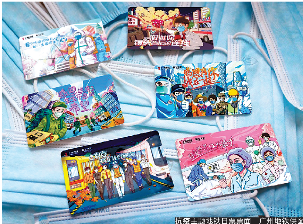
抗疫主题地铁日票票面

“为增强广大市民抗击疫情的信心,我们将该组漫画转移到日常生活中,以主题日票的形式发售,致敬最美逆行者。”广州地铁相关人员介绍,该套主题日票为地铁一日票,共有6款票面,限量发行3000套,每套售价120元,3月27日起通过微信小程序“地铁优选”进行预售,预计将于5月1日正式发行。