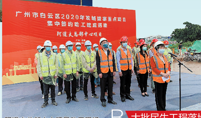
阿道夫总部中心项目动工现场

春回大地,万物复苏。当前,疫情带来的挑战依然存在,但复工复产“加速跑”已经开启。26日,广州白云区举行2020年攻城拔寨重点项目集中签约、动工、建成活动,其中,集中签约的10个化妆品产业项目总投资28亿元,预计达产年产值超100亿元;集中动工的40个攻城拔寨重点项目总投资达1135亿元,预计可形成当年固定资产投资467亿元;15个集中建成的攻城拔寨重点项目总投资257亿元。