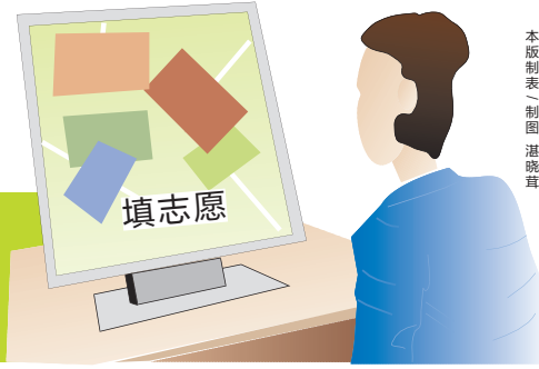
本版制图 制图 湛晓茸