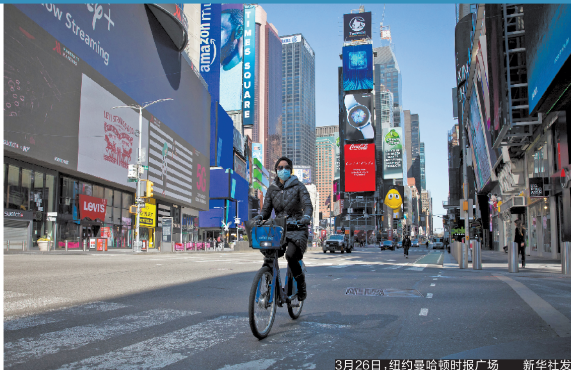
3月26日，纽约曼哈顿时报广场