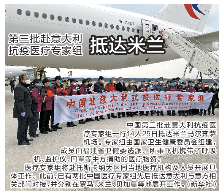
第三批赴意大利抗疫医疗专家组 抵达米兰

中国第三批赴意大利抗疫医疗专家组一行14人25日抵达米兰马尔奔萨机场。专家组由国家卫生健康委组建，成员由福建省卫生健康委选派。所乘飞机携带了呼吸机、监护仪、口罩等中方援助的医疗物资。医疗专家组将赴托斯卡纳大区当地医疗机构及人员开展具体工作。此前，已有两批中国医疗专家组先后抵达意大利与意方相关部门对接，并分别在罗马、米兰、贝加莫等地开展工作。(新华社)