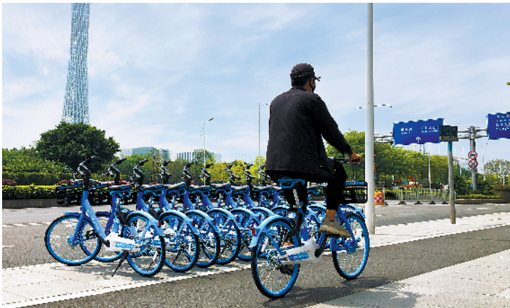
市民骑上新款“云行”单车