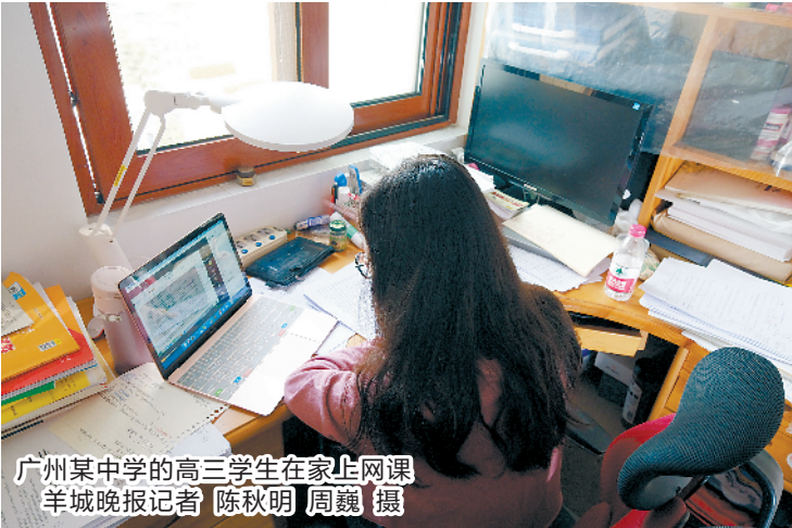
广州某中学的高三学生在家上网课

“云备考”中的城乡差别令人担忧。一些县级中学教师反映，乡镇学生不上网课、不交作业情况比城市学生多。还有一些地方的贫困户因家中孩子多，无法及时保证同时线上学习。