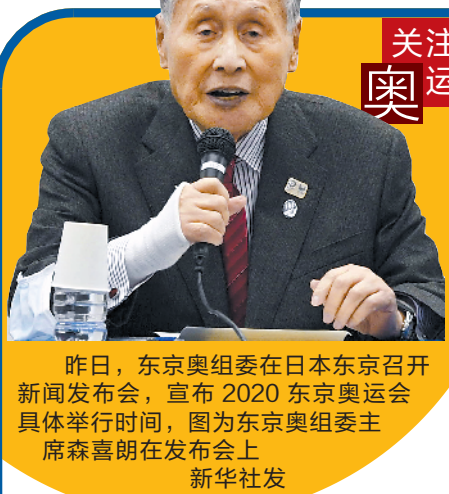
昨日，东京奥组委在日本东京召开新闻发布会，宣布2020东京奥运会具体举行时间，图为东京奥组委主席森重朗在发布会上。

在广东省社会体育中心的指导下，“一城一品”官方指定合作平台竞技嘉将以“为全民健康加Fun”为主题，于5月先期启动广东省全民健身科普活动，广泛宣传全民健身和健康科普知识。活动将每月以运动主题线上互动的创新形式，植入科学运动趣味小知识，同时发放海量福利奖品，吸引全民共同参与。(苏苒)