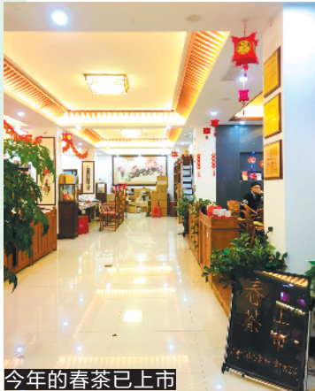
今年的春茶已上市