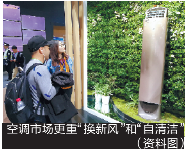
空调市场更重“换新风”和“自清洁” (资料图)

突如其来的新冠肺炎疫情，使得今年的家电市场呈现出健康家电走旺的态势。眼下正是空调集中上市的时段，“换新风”和“自清洁”成为了今年空调市场最大的看点。