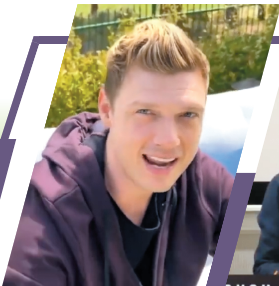
「后街男孩」五子连麦合唱

这波“青春回忆杀”让中国网友也非常激动。有人评论：“他们就算变成了后街老男孩，还是那么棒！”