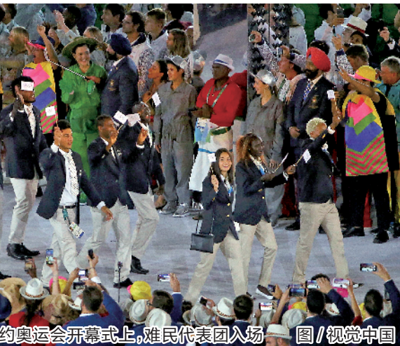
2016年里约奥运会开幕式上,难民代表团入场