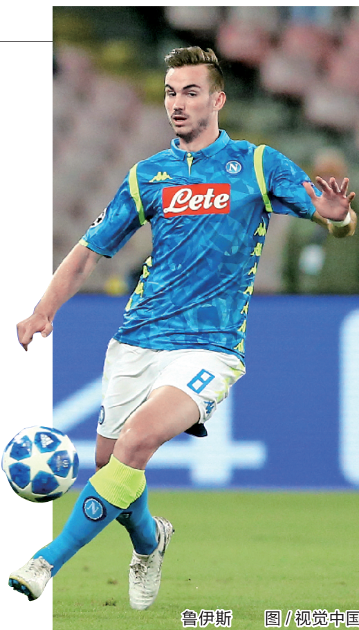
鲁伊斯 图/视觉中国

巴萨相中的新后卫,分别是多特蒙德的葡萄牙左后卫格雷罗和巴黎圣日耳曼的法国后卫瓦尔扎瓦。