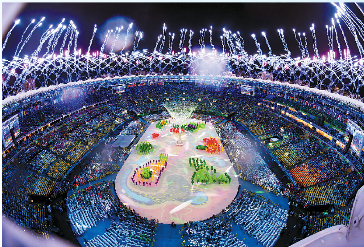
里约奥运会闭幕式

1896年，人类历史上首届现代奥运会在希腊雅典举行，自此，奥运会就成了和平与希望的代名词。公平竞争、互相理解、友谊团结，既是奥林匹克的精神，也是全人类的共同追求。现代奥运会已走过100多年的历史，夏季奥运会已举办了31届。虽然奥运寄托了人们对美好事物的向往，但还是有不和谐的杂音出现。这是百年奥运的遗憾，也是人类历史的遗憾。