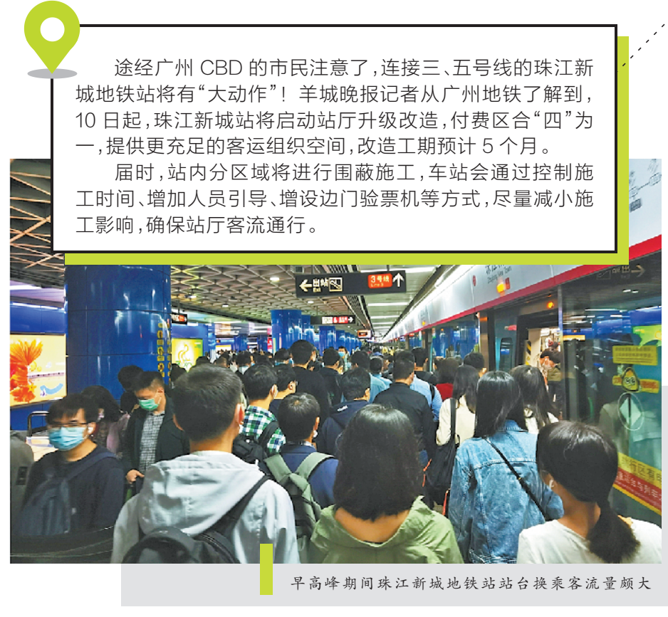
早高峰期间珠江新城地铁站站厅换乘客流量颇大