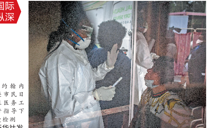
约翰内斯堡市民日前在医务工作者指导下接受检测

在拥挤、脏乱的贫民窟中，许多人每天排队取水或使用公共厕所，很难做到与他人保持距离。南非还有大量艾滋病病毒携带者，患结核病、糖尿病以及哮喘的人口比例也相当高，这意味着一旦新冠病毒在南非大规模传播，重症患者数可能较多。