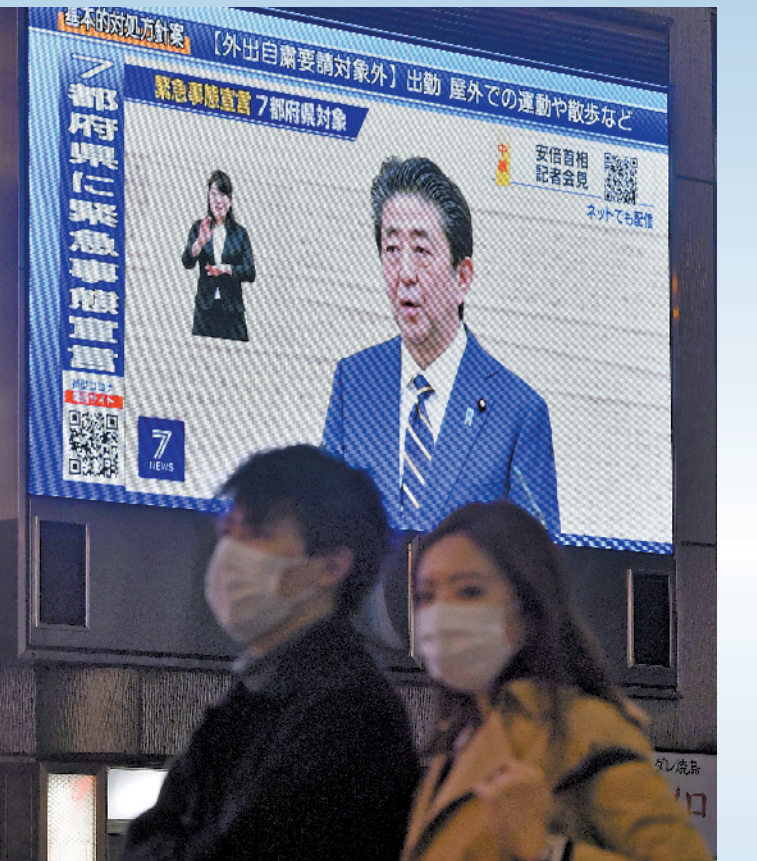
日本首相安倍晋三

日本首相安倍晋三7日宣布在7个地区实施紧急状态，呼吁民众尽量不要外出，要有“我可能是感染者”意识。