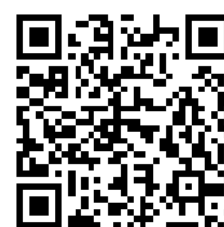
更多内容请扫二维码