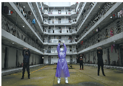
3月25日,武汉软件工程职业学院康复驿站,医生带领康复隔离人员做八段锦