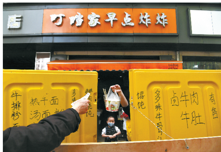
4月8日,武汉解封离汉通道首日,西马路上的一家小吃店卖起了热干面