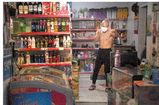
4月2日,武汉黄兴路路口,一家小卖部的老板在练拳击