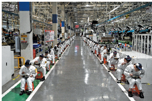
3月24日,武汉东风本田二厂,复工的总装车间流水线上,工人每人间隔1.5米吃午餐