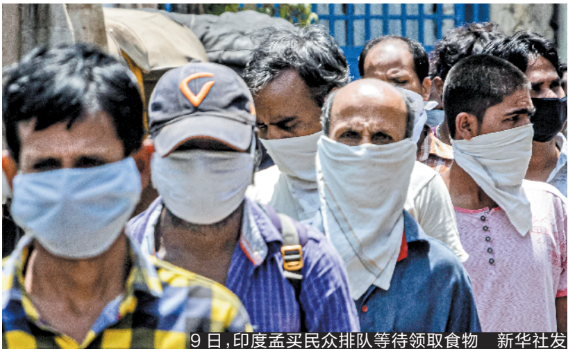
9日,印度孟买民众排队等待领取食物