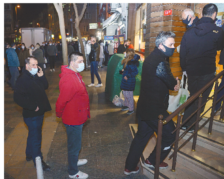
4月10日晚，在土耳其伊斯坦布尔，人们在“居家令”开始实施前排队购物