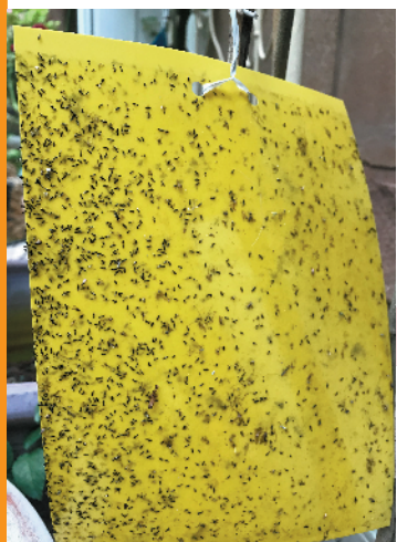
有市民不用涂抹粘胶,也能让一批小虫“撞板”

你最近被“小黑虫”困扰吗?羊城晚报记者近日接到广州市民反映,自家颜色鲜艳的衣服、阳台绿色植物等,受到一种奇怪的小黑虫侵占。小虫的聚集不仅带来让人不安的“密集恐惧症”,还让市民担忧小虫会否带来皮肤疾病。经个别小区通报和专家初步辨认,这种小虫名为“蓟马”。目前,已有受这类小虫影响的小区采取消杀方式灭虫,相关专家建议市民根据该虫的一些特性,采取相应防御措施。