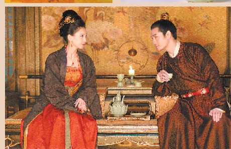
温酒壶原件现藏于北京故宫博物院