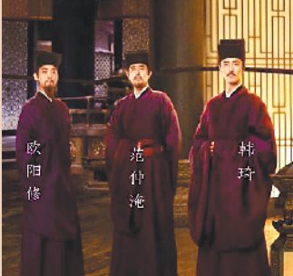
剧中的大文豪被网友称为“天团”