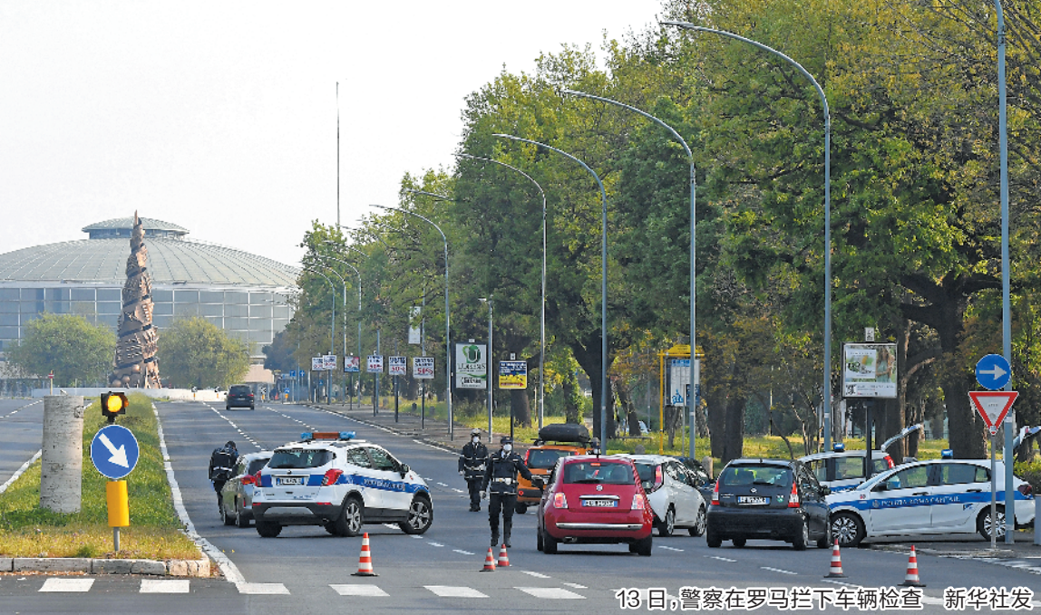
13日，警察在罗马拦下车辆检查。

出动直升机、无人机等进行巡查。意大利内政部13日说，警方12日对21.4万人和6万多户商家进行检查，发现1.38万起违反规定事件。 意大利交通部长德米凯利对媒体表示，从目前的“封城”阶段过渡到逐渐恢复经济和社会活动的紧急状态第二阶段后，可能会实行错峰上班，人们使用公共的方式也可能与以往不同。他说，是否过渡到第二阶段将由中央政府根据卫生部技术和科学委员会的建议来决定。