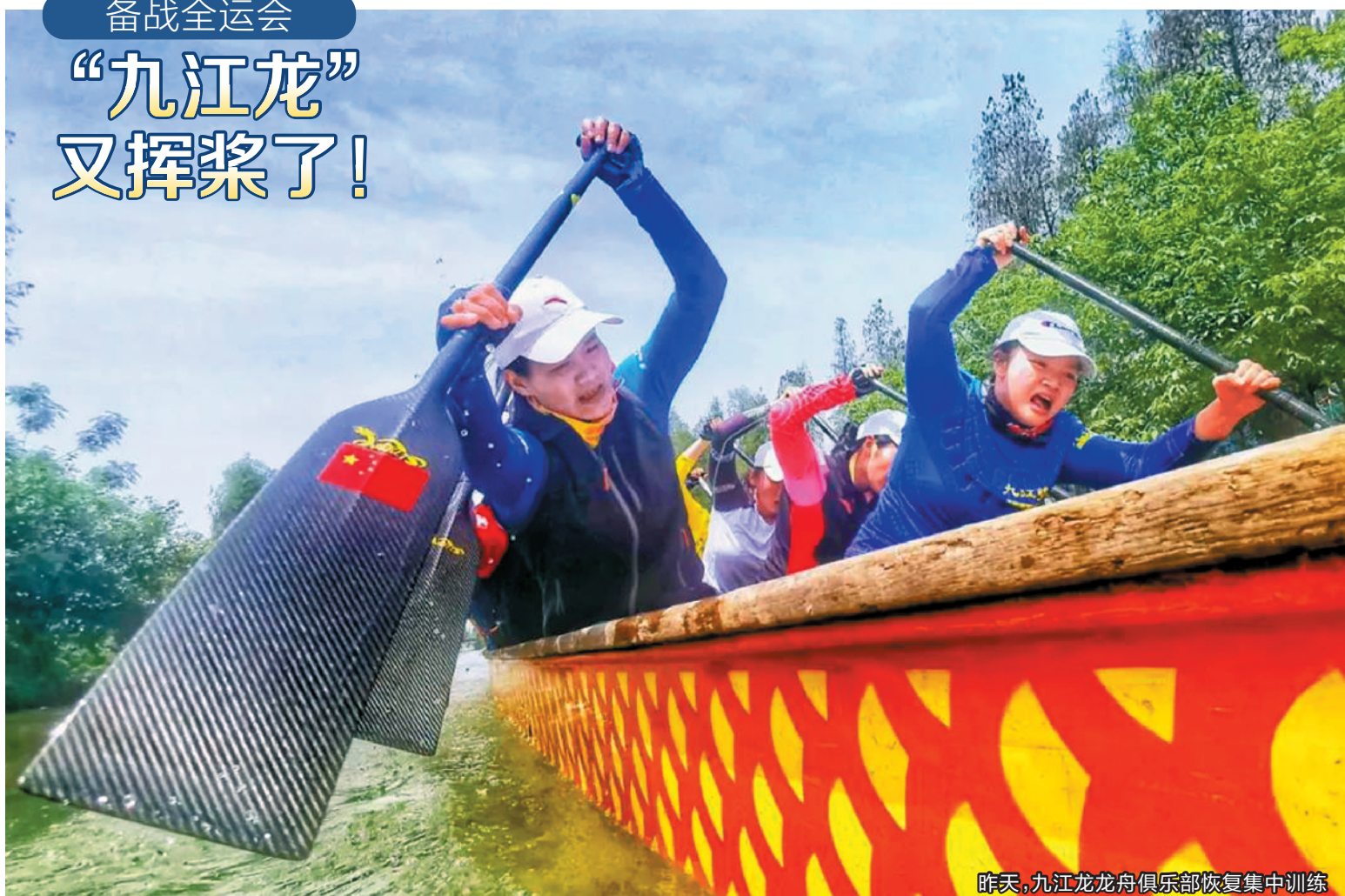
昨天,九江龙龙舟俱乐部恢复集中训练

羊城晚报讯 记者张闻、通讯员梁平摄影报道:整齐有力地挥桨,在训练水道上往返穿梭!昨天,“冠军常客”佛山市南海区九江龙龙舟俱乐部恢复集中训练,全力备战各项赛事。