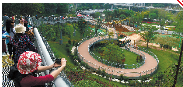
游客今早在云道上拍照

羊城晚报讯 记者严艺文报道:记者从白云山风景名胜区管理局获悉,白云山麓湖越秀山连通工程(以下简称“云道”)试运行以来,市民游客接踵而至。为减少疫情传播风险,避免大量游客聚集拥挤,云道从4月16日起实行分时段预约制度,每小时限定游客人数4000人。疫情期间,云道开放时间为每日9时至17时。现开放的入口包括越秀公园南门、越秀公园东门、雕塑公园东门、下塘西天桥入口、麓湖公园聚芳园入口,游客需预约进入。游客关注添加“白云山风景名胜区”公众号后,点击“景区服务”-“预约购票”-“连通工程预约”菜单,进入“连通工程预约”程序,根据相应时段和预约剩余人数,选择具体游览日期和时间。游客预约成功后,携带身份证前往任一“连通工程”入口,在入口处配合工作人员进行预约身份、“穗康码”核验及体温检测,检测通过后方能进入。白云山风景名胜区管理局提醒,因云道部分设施尚不健全,轮椅、儿童车通行存在困难。