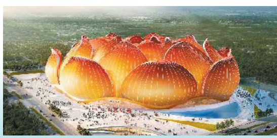
恒大足球场项目效果图

今天上午,广州南站商务区恒大足球场项目在番禺区顺利开工。记者获悉,该项目为中国首座现代化的超大型专业足球场,总投资120亿元,按照世界最高水准打造,座位超10万个,规模超越西班牙巴塞罗那队主场诺坎普球场,将成为世界最大的顶级专业足球场,计划在2022年年底竣工并投入使用。(罗仕 番禺)