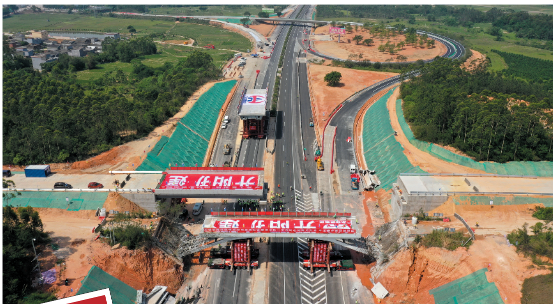
15日,广东开阳高速改扩建使用SPMT模块智能移运技术,在全国首次实施高速天桥同步拆除与搭建

在建筑领域,广东电网结合建筑节能技术,有组合、有重点的推广热泵和电蓄冷空调技术。“广东的夏季对于空调制冷需求较大,我们结合蓄冷优惠电价,为企业推广电蓄冷空调技术”广东电网相关负责人介绍。